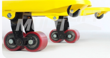
Ruedas de Poliuretano tipo tándem.