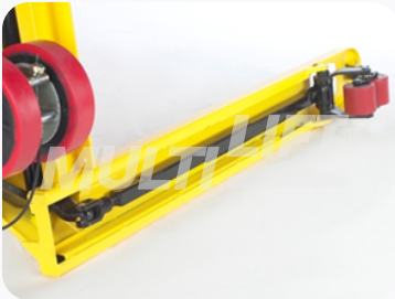
Construcción ultra reforzada.