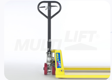
Maneral de operación con manija de 3 posiciones de control hidráulico. Palanca de freno adicional.