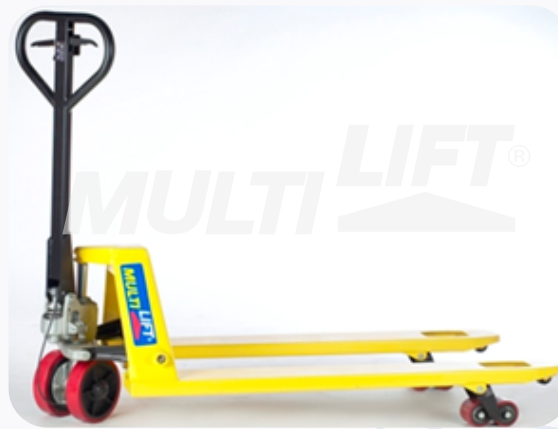
Estructura de Acero con ruedas delanteras y traseras de poliuretano.