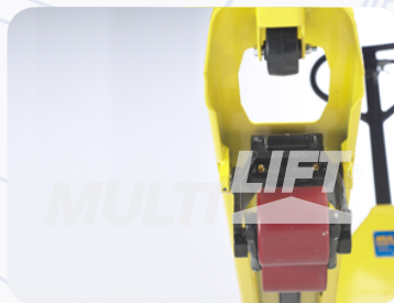
Rodillos de entrada y salida adicionales