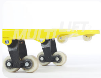
Ruedas de Nylamid tipo tándem.