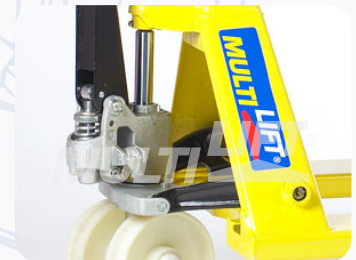
Bomba hidráulica de una sola pieza, que maximiza eficiencia y productividad.