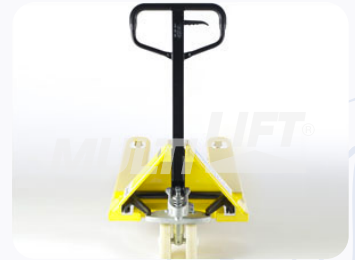
Maneral de operación con manija de 3 posiciones.