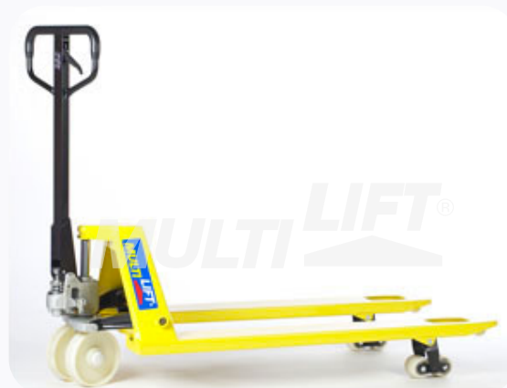
Estructura de Acero con ruedas delanteras y traseras de nylamid.