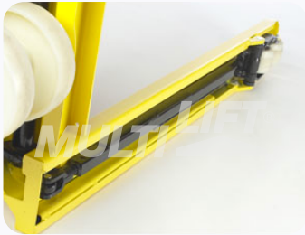
Construcción ultra reforzada.