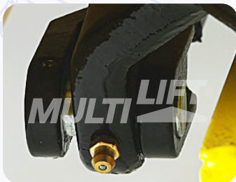
Graseras de lubricación en puntos clave.