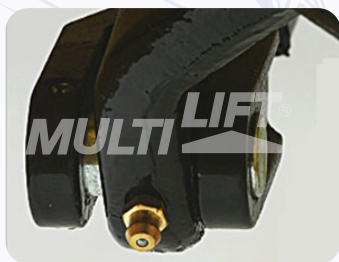
Graseras de lubricación en puntos clave.