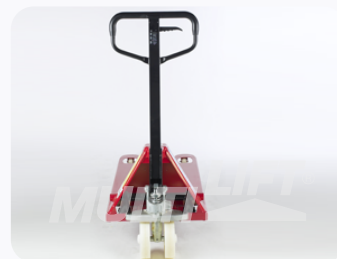
Maneral de operación con manija de 3 posiciones.