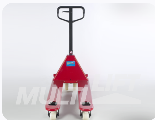
Ancho de Horquillas adecuado para manejo de tarimas angostas o europeas.