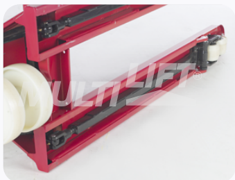
Construcción ultra reforzada.