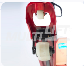
Rodillos de entrada y salida adicionales.