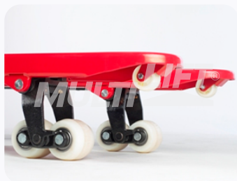
Ruedas de Nylamid tipo tándem.