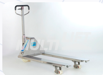
Fabricado con Acero Inoxidable grado 304.