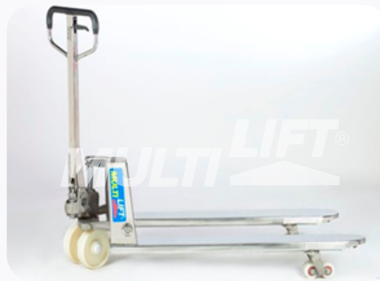
Estructura de Acero con ruedas delanteras y traseras de nylamid.