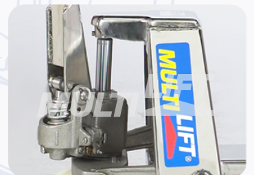
Bomba hidráulica de una sola pieza, que maximiza eficiencia y productividad.