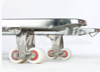
Ruedas de Nylamid tipo tándem.