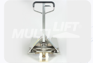
Maneral de operación con manija de 3 posiciones.