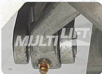
Graseras de lubricación en puntos clave.