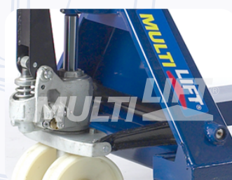
Bomba hidráulica de una sola pieza, que maximiza eficiencia y productividad.