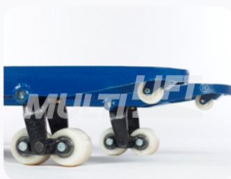
Ruedas de Nylamid tipo tándem.