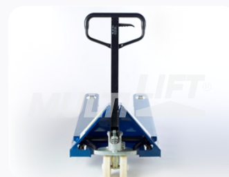
Maneral de operación con manija de 3 posiciones.