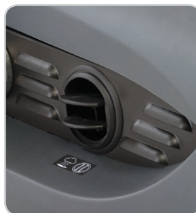
Válvula de escapa para barrido en húmedo, protege el filtro de cualquier salpicadura de agua cuando se barre en condiciones húmedas.