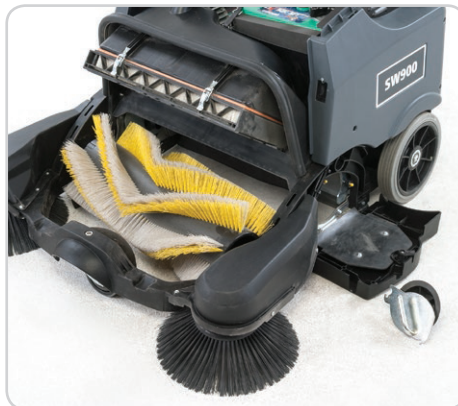
Ahorro de tiempo en mantenimiento: reemplazo de cepillos y otras tareas de mantenimiento rutinario sin necesidad de herramientas.