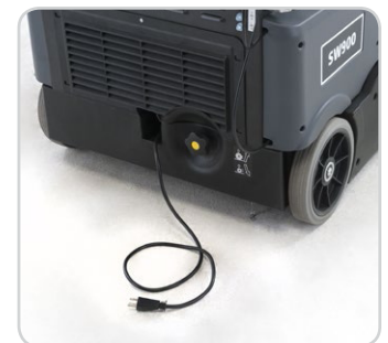
Cargador a bordo, brinda la facilidad de cargar en cualquier lugar donde se encuentre una toma de corriente.