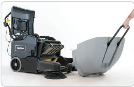
Instalación y remoción de la tolva con una sola mano, incorpora ruedas que facilitan el transporte y el vaciado de la tolva