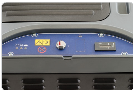
Panel de control con interruptor principal, indicador de carga de batería y contador de horas de uso