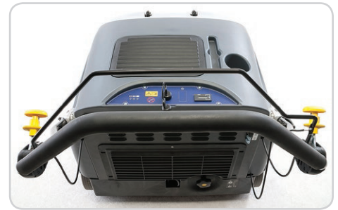
Todos los cepillos son ajustables desde la posición del operador.