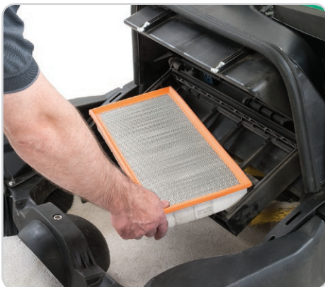
Sistema de filtración de alta capacidad de una etapa para un control de polvo más efectivo. Acceso al filtro sin necesidad de herramientas.