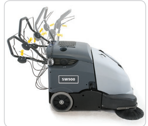
Manubrio ajustable que se adapta a una amplia gama de usuarios. Plegable para brindar un fácil transporte y almacenaje.